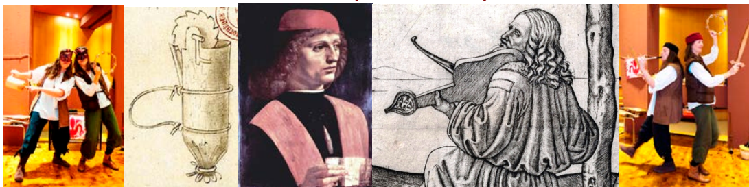
Instrumentenentwurf, Jüngling und Bühnenbildentwurf Höhle des Pluto von Leonardo – Leonardo (?) als Orpheus mit Fidel

„Lamento di Tristano“ und „Trotto“, anonym